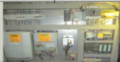
تصویر شماتیک دستگاه